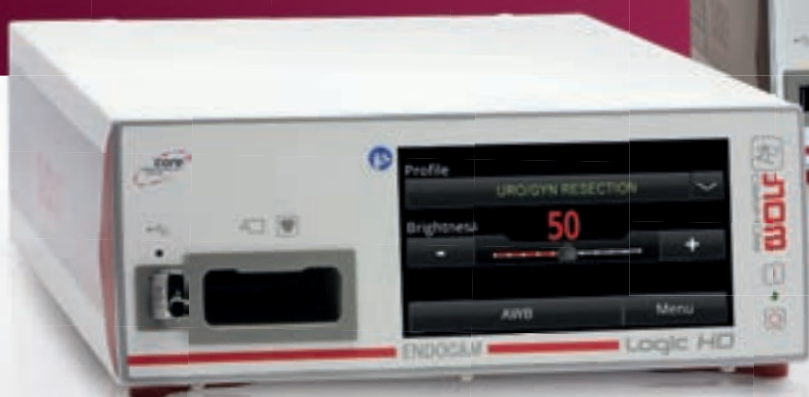
ENDOCAM Logic HD