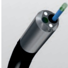
Отклонение на 270° вверх/вниз с введенным в рабочий канал инструментом