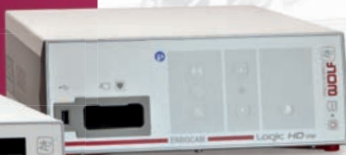
ENDOCAM Logic HD lite

BOA vision и COBRA vision интегрированы с контроллерами последнего поколения: Logic HD и Logic HD lite. Широкий выбор головок видеокамер позволяет использовать новые контроллеры во всех направлениях медицины.