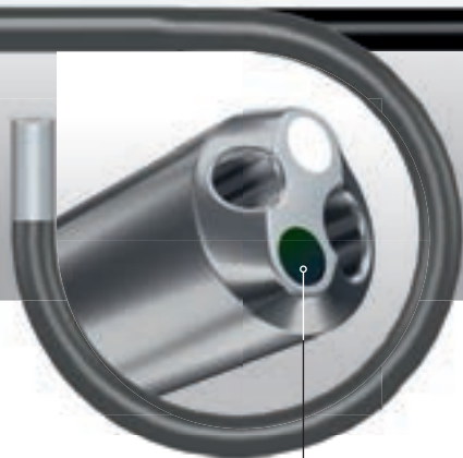
Расположение сенсора на кончике инструмента

Количество выполняемых уретерореноскопий продолжает увеличиваться. BOA vision и COBRA vision охватывают полный спектр клинических применений. Самый маленький диаметр BOA vision идеален для большинства ситуаций. Единственный на рынке 2-х канальный уретерореноскоп COBRA vision особенно рекомендуется для использования в лечении мочекаменной болезни. Используя эти 2 инструмента в своей практике, урологи получают универсальные и высокотехнологичные способы лечения пациентов.