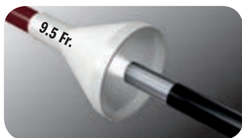
Может использоваться с кожухом 9,5 Fr.