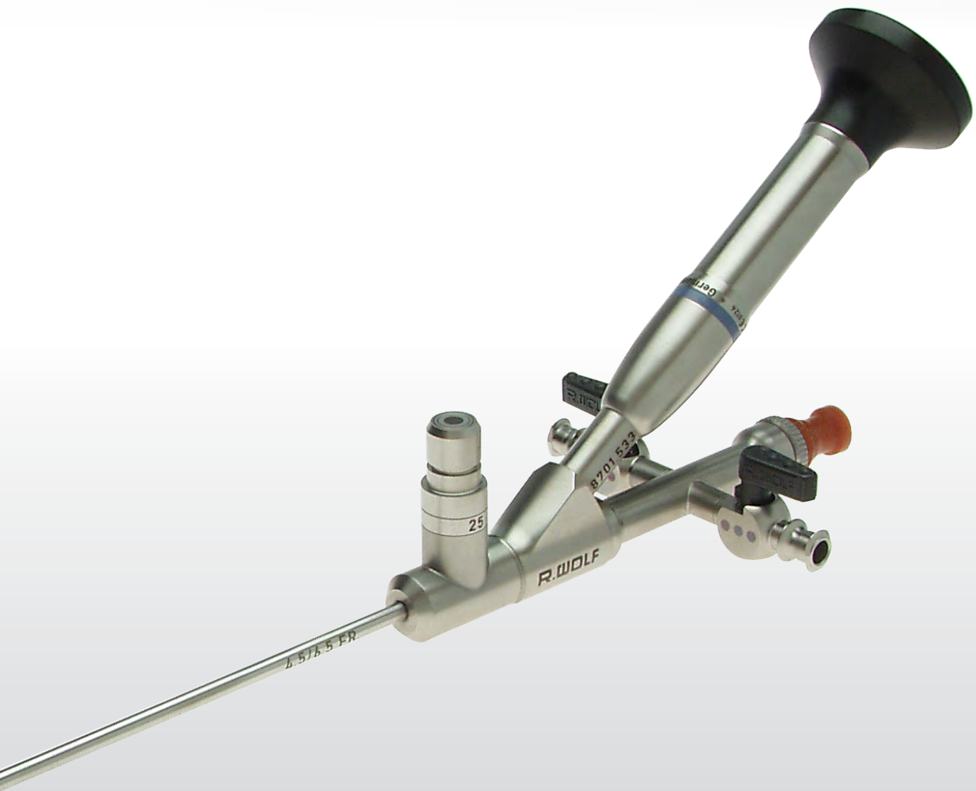
Уретерореноскоп ультратонкий 4.5 / 6.5 Шр.